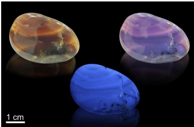
Foto 1.- Ámbar de El Soplao (Cantabria) con bandas oscuras ricas en savia, visto con luz artificial (izquierda), solar (derecha) y ultravioleta (centro).